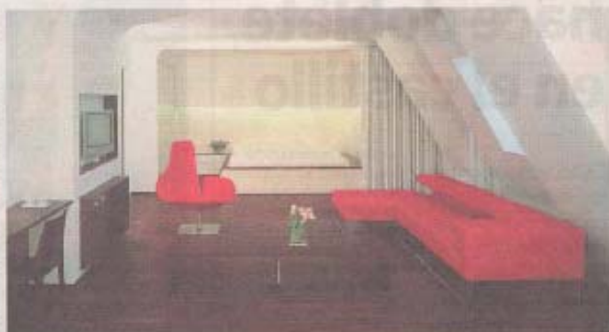
Habitación del hotel Q! con su dos en uno de bañera y cama.

E l pasado Mundial ha relanzado la imagen moderna y dinámica de la ciudad germana. Mitte se confirma como uno de los barrios más vanguardistas de Europa. Estas son algunas de mis direcciones favoritas para una escapada de fin de semana.