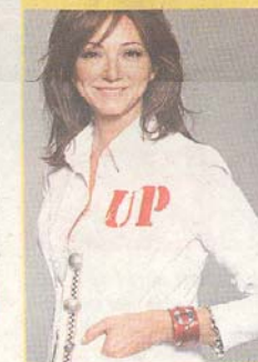
Ana Rosa Quintana.

Ana Rosa no verá su programa entero durante el verano