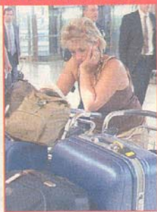
Una viajera espera en Barajas.

La huelga que los pilotos de Iberia mantenían desde el pasado lunes terminó ayer al aceptar el compromiso ofrecido por la empresa. No obstante, la normalidad en los vuelos no se recuperará hasta mañana viernes como pronto.