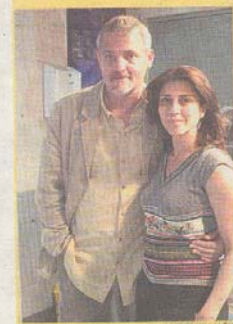
Jordi Rebellón y Alicia Borrachero.

Hasta el médico del director de 'Hospital Central' ve la serie