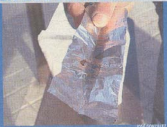
Una papelina de cocaína.

udad Lineal, Hortaleza, Centro, Retiro, Tetuán, Chamberí, Fuencarral, Moncloa, San Blas y Carabanchel conforman el nuevo mapa de la droga.