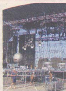
Montaje de Depeche Mode.