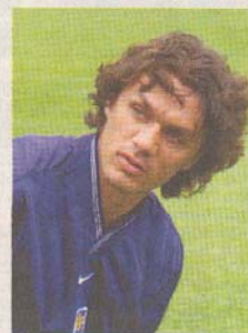
Paolo Maldini, defensa del Milan. MASCA

El jugador del Milan, Paolo Maldini, de 38 años, será la imagen de la colección de otoño para hombres de la cadena de ropa sueca. "El estilo informal y elegante de Maldini encaja a la perfección con esa línea clásica y personal", señaló H&M.